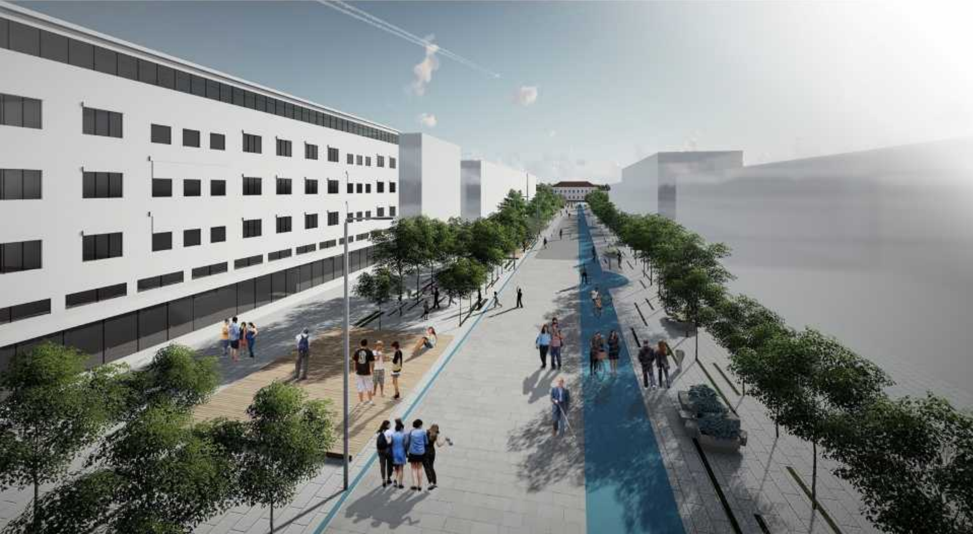
Темерин 2020: Партерно уређење дела центра насеља Темерин др Дубравка Ђукановић д.и.а, КЦОТ, 2017. Илустрација: Микроамбијент улице Петефи Шандора